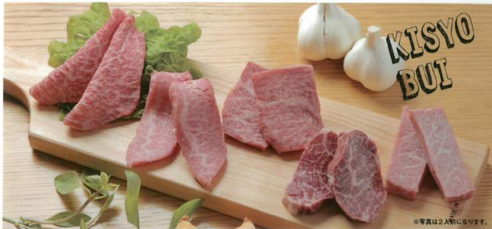
※写真は2人前になります。