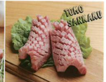
牛の肩からお腹にかけてに位置する部位。

友三角【厚切り特選ローズ】 Tomosankaku 1人前 ¥1,500 ハーフ ¥750