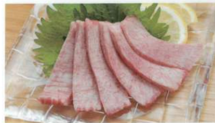
最高級の和牛の中でも、希少価値の高い牛タン。

並タン 1人前 ¥1,200 上タン 1人前 ¥2,000 ハーフ ¥1,000