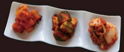
キムチ盛り合わせ