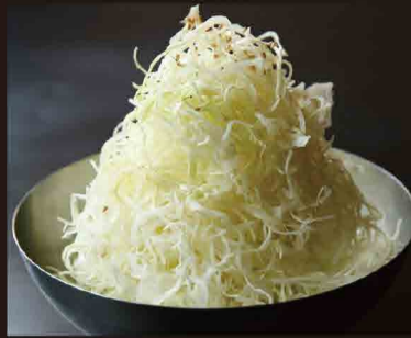
おもいきり! キャベツ